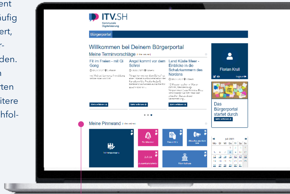
Pinnwand mit verfügbaren Diensten

Die Pinnwand stellt das zentrale Element des Bürgerportals dar. Hier können häufig benötigte Dienste abgelegt, positioniert, farblich angepasst, vergrößert und verkleinert und auch wieder entfernt werden. Die Pinnwand entspricht der zentralen Menüfläche, von der aus die favorisierten Dienste gestartet werden können. Weitere verfügbare Dienste finden sich im nachfolgend beschriebenen Angebotskorb.