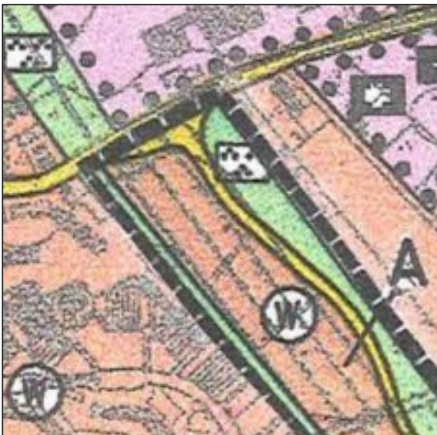
Abbildung 1: Darstellungen des wirksamen Flächennutzungsplanes inkl. 1. Änderung

Der wirksame Flächennutzungsplan (1. Änderung) stellt für den Planänderungsbereich Wohnbauflächen sowie für den westlichen Rand des Plangebietes eine Grünfläche dar.